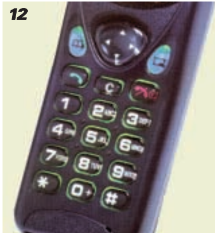
12 Telefon o klawiszach odpowiedniej wielkości, wygodnie rozmieszczonych.

Trudno mi podać gotowy sposób na kupowanie „komórki”. Nowe modele pojawiają się praktycznie co kilka miesięcy. Każdy z nas – klientów – ma inny gust i potrzeby. A także możliwości finansowe. Mogę jedynie zaproponować kilka zasad, które powinny być uwzględnione podczas dokonywania upragnionego zakupu.